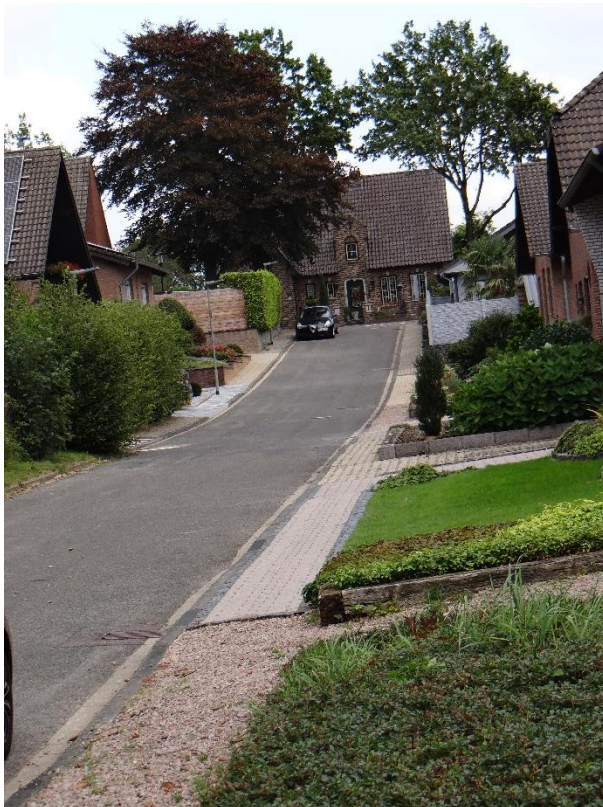
Blick vom Grundstück